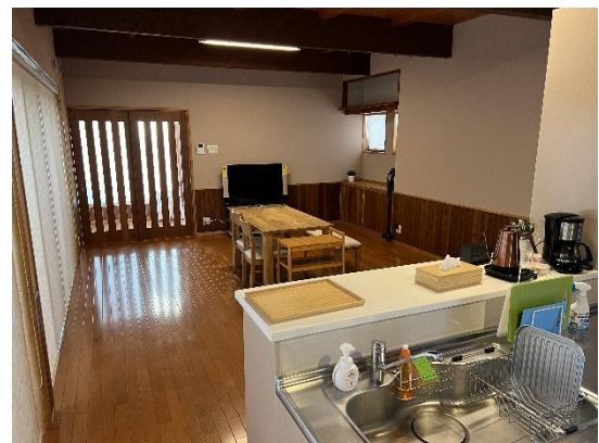
1階 リビング・キッチン